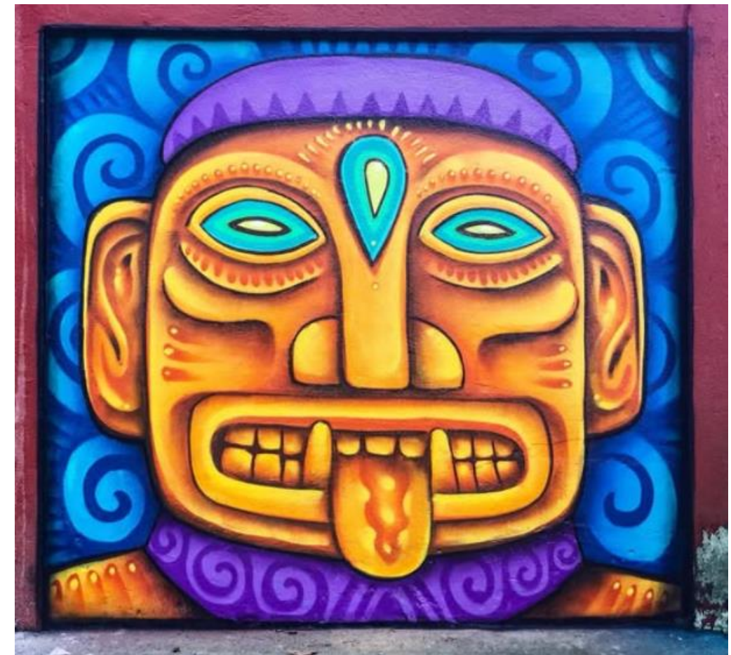
“Sibö”: Deidad Bribri

Deidades y espíritus: Las deidades y los espíritus estaban relacionados con aspectos naturales y cósmicos. Por ejemplo, los Bribri adoraban a deidades asociadas con la naturaleza, como el dios del fuego y el dios de la lluvia.