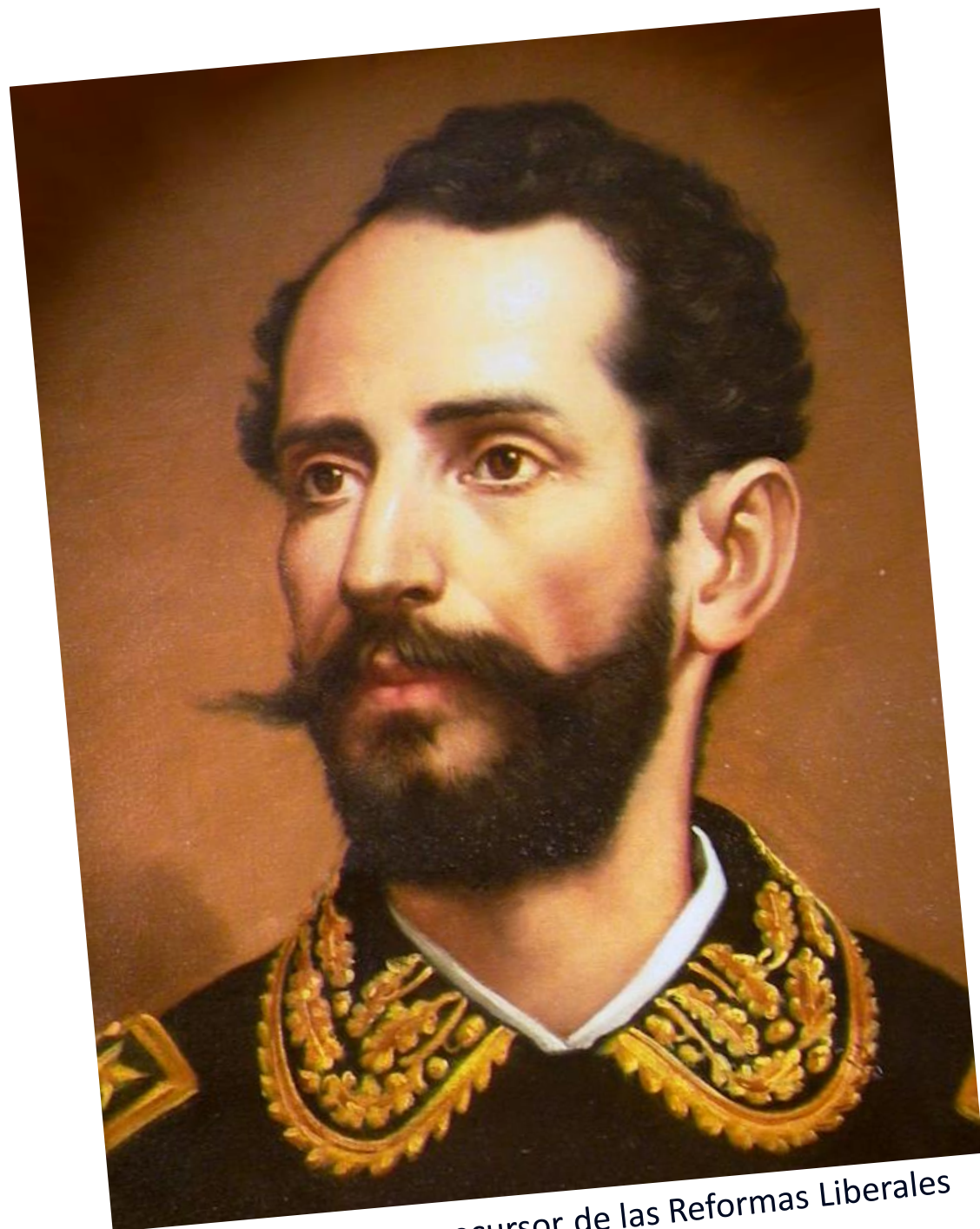
Tomás Guardia, precursor de las Reformas Liberales