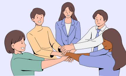
Resumen de la estrategia trabajo colaborativo