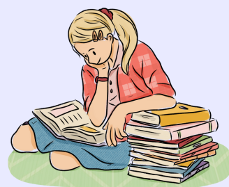
Resumen de la estrategia enriquecimiento curricular