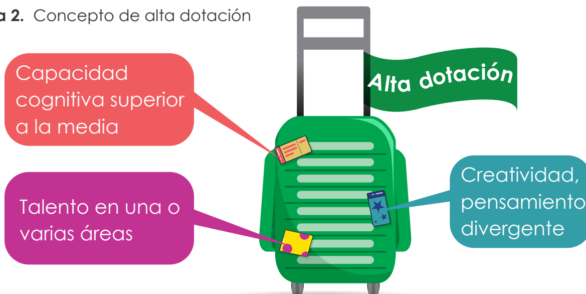
Figura 2. Concepto de alta dotación