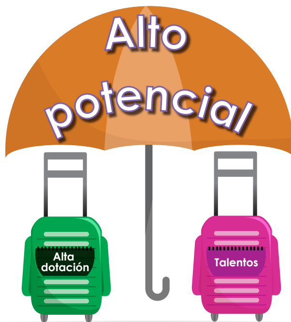
Figura 1. Concepto de alto potencial